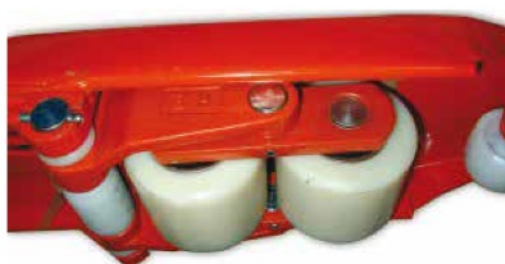
Ruote di guida e ruote di carico di Nylon, gomma o poliuretano